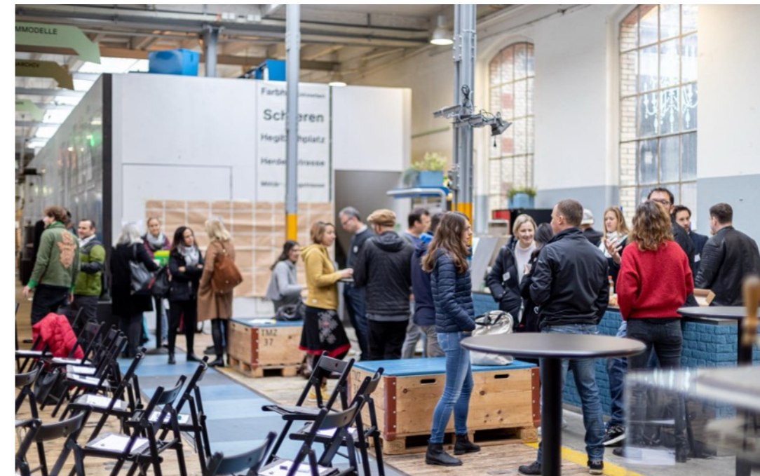
Session-Planung - ein typisches Element eines Barcamps.

Im Lernhaus Sole in Glarus fand am 15.10.22 ein weiteres Barcamp mit 20 Teilnehmer:innen statt. Hier wurden fünf Projekte gefördert.