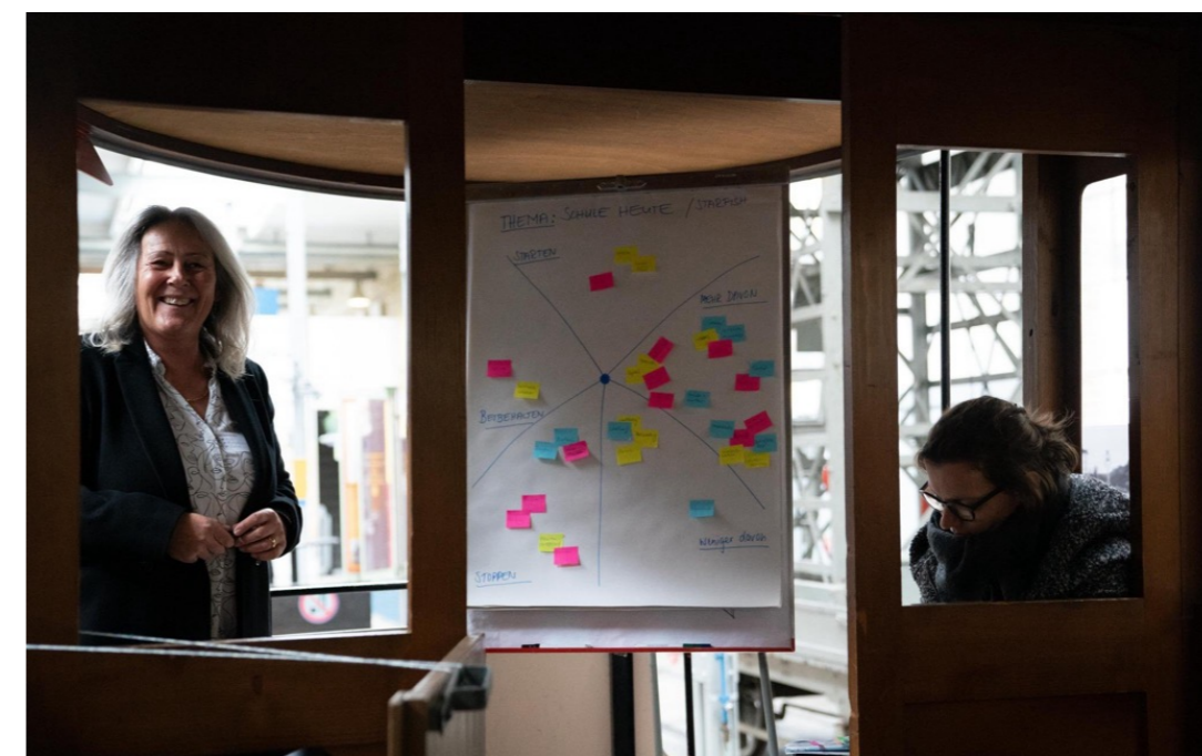
Volles Engagement in einer Session - alle werden zu Teilgeber:innen